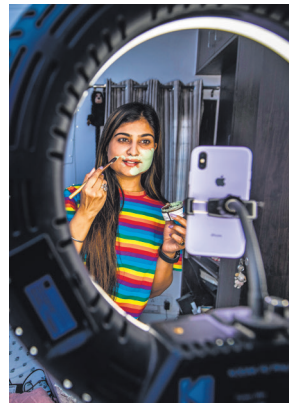
The creator economy is poised to grow by 25% in 2024, turning into a ₹2,344 crore industry.

"The number of followers they have is an important metric for deciding the commercial value of the arrangement... We should consider signing up with an influencer based on the level of engagement they have with their followers to test the reach of the brand," Bawa added. The realization comes at a time when influencer marketing has become an integral strategy to promote products, drive sales, and create an impact. According to an EY